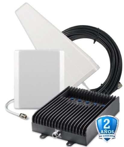
Fusion5s Kit Yagi/Panel SC-PolyH/O-72-YP-CA-Kit